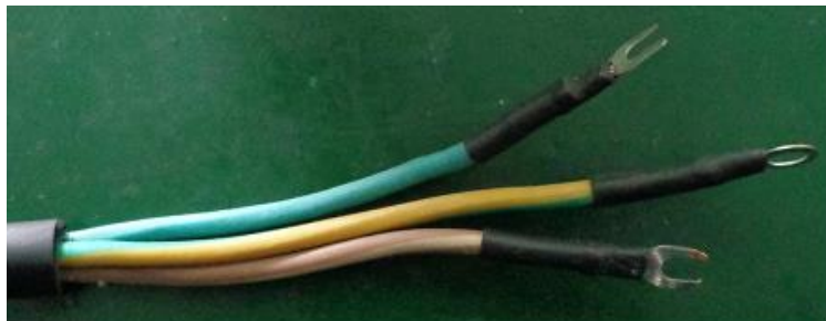
3 провода однофазного силового кабеля: коричневый, синий и желто-зеленый

Устройство, оборудованное силовой вилкой, подключается к обычной розетке. Однако от обычной бытовой 16-амперной розетки 220В возможна работа только в режиме зарядного устройства 12-вольтовых батарей. Пусковой режим даже автомобилей с сетью бортового питания 12 вольт требует более мощного источника питания, чем обычная розетка, рассчитанная максимум на 3.68кВА. Как правило, таким источником служат специальные силовые выводы на электрощите. Однофазная модель 1000А и трехфазная 1500А поставляются без силовой вилки.